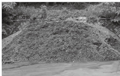
剪定木を加工した 「雑ウッドチップ」